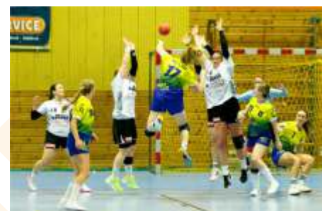
(Dieter Vogel)