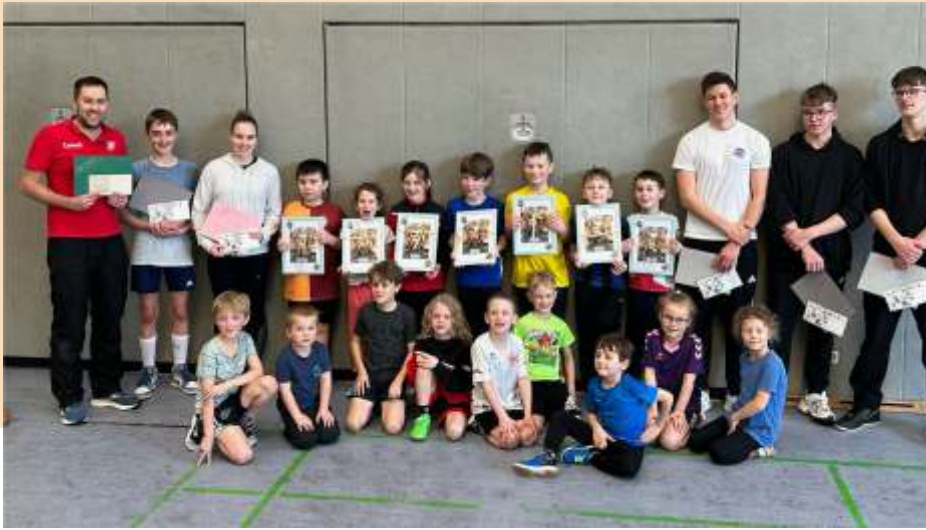
Die Kinder des Jahrgangs 2015, die sich nun auf die gemischte E- Jugend freuen

ein kleines Geschenk von uns zum Abschied bekommen. Sie waren jede Woche für uns da, sind mit uns auf Turniere und Spieltage gefahren und hatten meistens viel Spaß mit uns.