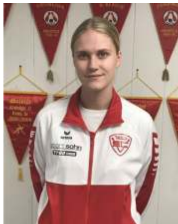
Starkes Schlusspaar sicherte den Sieg