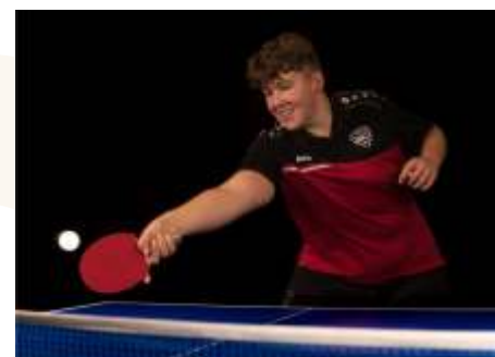
David mit souveräner Leistung in Laichingen

In der zweiten Einzelrunde machte unsere Mannschaft den Sack dann schnell zu.