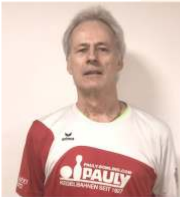
Horst trug 554 Holz bei